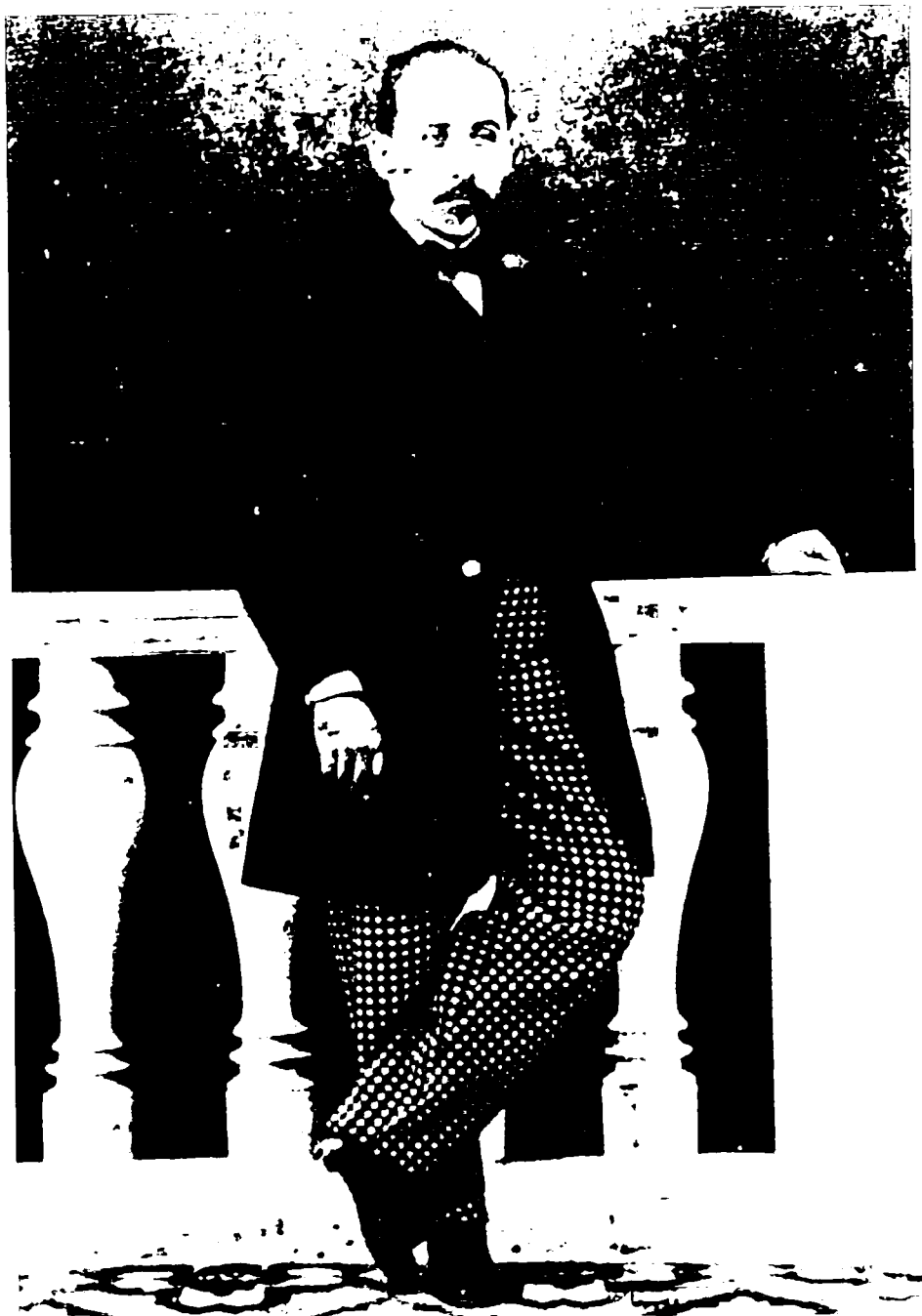
Luigi Capuana - 1 aprile 1864.